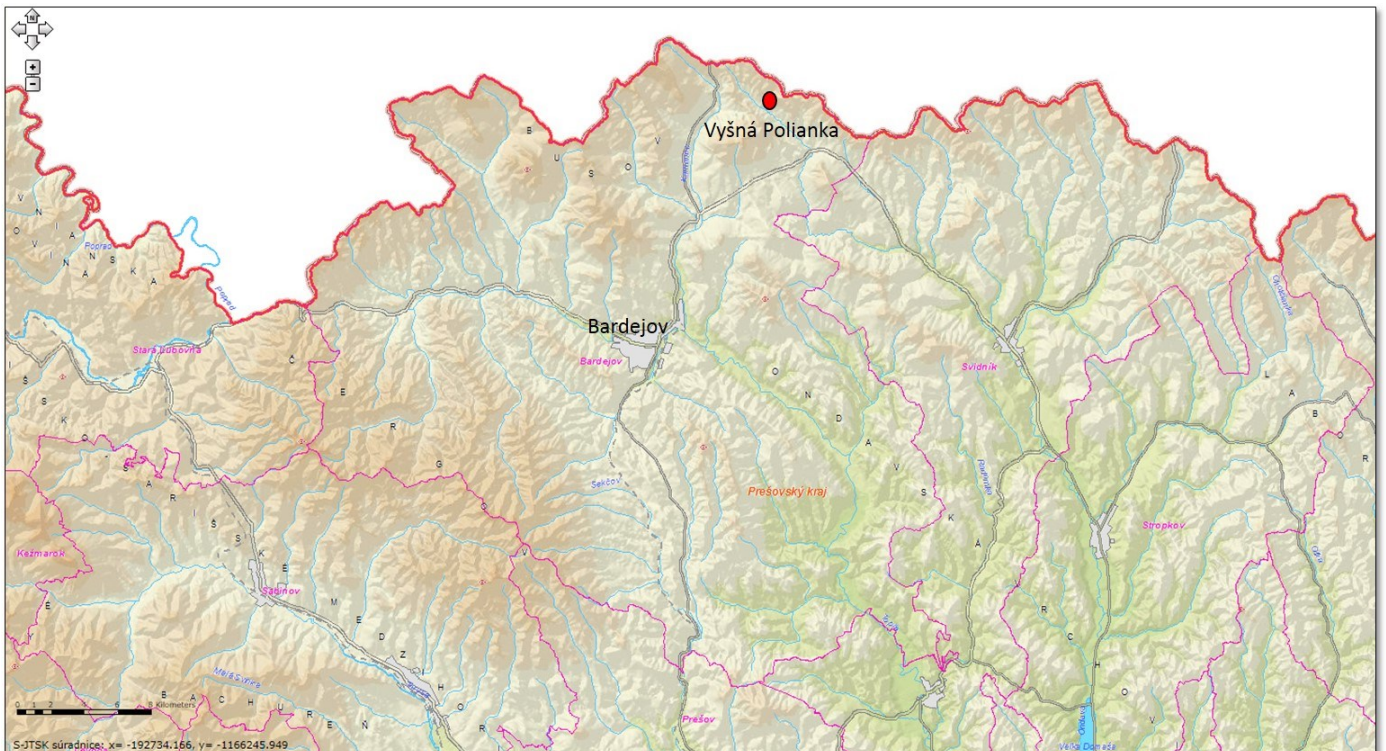
Mapa č.1: Geografická poloha obce v rámci okresu Bardejov

ZDROJ: Atlas krajiny SR ( http://geo.enviroportal.sk/atlassr/ )